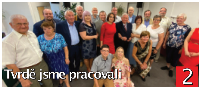
Tvrdě jsme pracovali