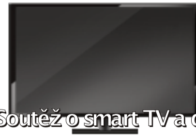
Soutěž o smart TV a další ceny