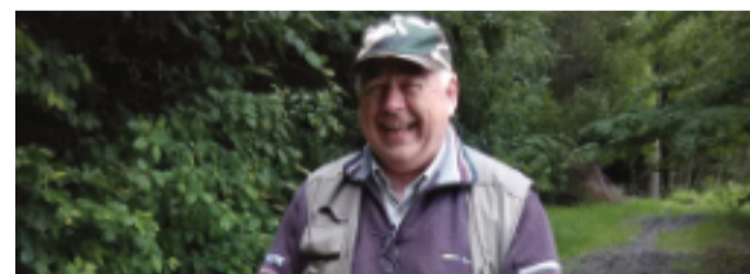
pokračování na str. 3

Druhým velkým problémem – a s tím se pojí i naše jihomoravské volební heslo – je sucho a zadržování vody v krajině. Jak už jsem říkal, KSČM na tento problém začala upozorňovat ještě v době, kdy to nebylo módní záležitostí. Nyní s nelibostí sledujeme kladné stanovisko baňského úřadu k těžbě šterkopísku na Hodonínsku.